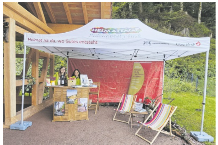
Stand der Renchtal Tourismus GmbH und Heimattage bei „Tal X“