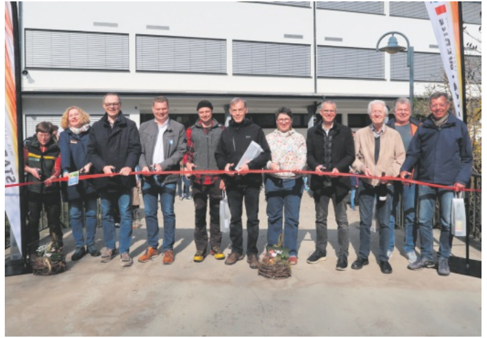
Eröffnung des neuen Erlebnispfades Flori Forelle in Oberkirch-Ödsbach

Weitere Informationen sowie die digitale Route des Erlebnispfades und der neue Flyer inklusive Streckenbeschreibung sind unter www.renchtal-tourismus.de verfügbar.