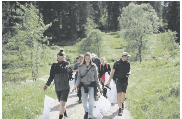
Schwarzwald CleanUp Days